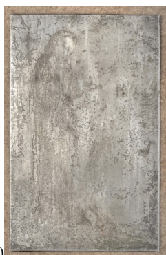
(a) Abel, poniklovaná zinková destička, 250 x 160 mm. Soukromá sbírka, Česká republika

Tisknout grafiky s barvou se ukázalo být složitější. Reynek se vydal osobitou cestou, aby dosáhl barevného provedení svých grafických listů. Nejprve se pokoušel své tisky dobarvovat barevnými krajony, rudkou nebo lehkými olejovými barvami. Později se snažil nabarvit samotnou destičku dvěma či třemi barvami a tisk uskutečnit jediným protažením satinýrkou, ale těchto pokusů velmi rychle zanechal. Jeho snahy vyústily do techniky zvané „s monotypem“, která vyžaduje dvojí protažení lisem. Na vyrytou destičku (a) se nejprve prstem nanese barva, pak se protáhne satinýrkou: takto vznikne „monotyp“ (b). Grafik pak z destičky odstraní barvu a znovu ji potře další jedinou barvou, tmavou kreslicí černou, a tuto destičku pak znovu otiskne na barevný grafický list. Veškerá potíž spočívá ve správném soutisku – tak, aby se vrypy kryly s barevným podbarvením monotypu. Proces s monotypem zrodil skutečně jedinečná díla (c).