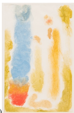
(b) Monotyp jedné varianty Abela. Soukromá sbírka, Francie.