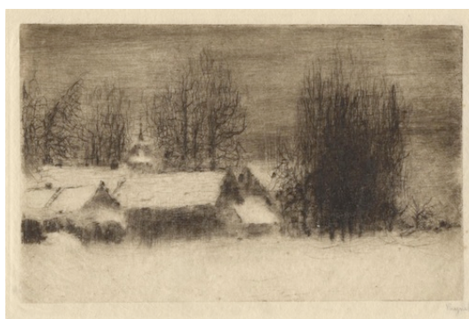
Petrkov (1962), suchá jehla, 137 x 217 mm. Soukromá sbírka, Francie.

Annick Auzimour Académie delphinale 27. října 2012 14