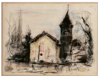
Kostel v Saint-Nizier-d'Uriage (1933), pastel, 240 x 315 mm. Galerie výtvarného umění v Havlíčkově Brodě, inv. č. K 639

Během svého tvůrčího života používal Reynek v několika takřka oddělených obdobích řadu technik. Začínal s malbou, poté kreslil tuší, uhlem a pastelem, vzácněji akvarelem. Tyto techniky převládaly až do počátku třicátých let. V letech 1920-1921 výjimečně zkoušel vytvářet linoryty. Od roku 1933 přestal umělec kreslit a až do své smrti v roce 1971 se věnoval grafice. Pracoval se suchou jehlou a leptem a tyto rytecké způsoby často provozoval souběžně. V roce 1952 se zabýval technikou cliché-verre. A rozvíjel i velice osobité grafické umění, suchou jehlu s monotypem.