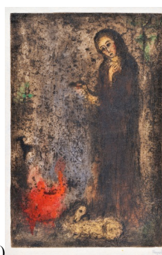
(c) Abel (1955), lept, suchá jehla s monotypem. Galerie výtvarného umění v Havlíčkově Brodě, inv. č. G 195.